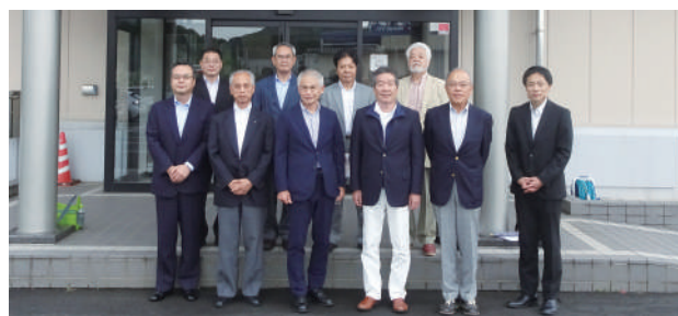
▲ 松江流通センター組合会館前