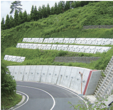
▲ 林道災害復旧工事