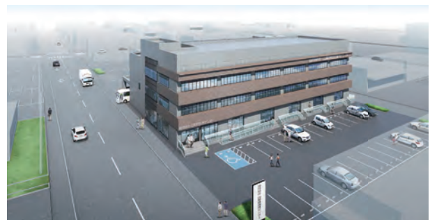
新組合会館イメージ図